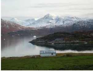
le printemps à Ipiutaq

Située le long du fjord principal du sud du Groenland