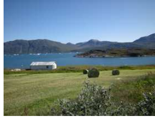
l'été à Ipiutaq