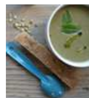
soupe à l'oseille