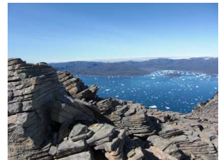
vue sur le fjord voisin

A Ipiutaq guest farm, vous pouvez découvrir l'agriculture et la nature sauvage du Groenland , partager notre table d'hôtes en découvrant une nouvelle cuisine , profiter des activités de plein air , telles que la pêche, la randonnée, le camping ou le travail à la ferme, ou bien vous détendre en admirant le paysage dans un cadre inhabituel et somptueux .