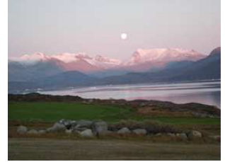
au bout du monde

Située le long du fjord principal reliant Narsarsuaq - l'aéroport international du Sud du pays - aux villes de Narsaq puis Qaqortoq, Ipiutaq guest farm offre une grande diversité de paysages , des hauts pics enneigés, torrents et chutes d'eau aux longues plages rocheuses et verts pâturages.