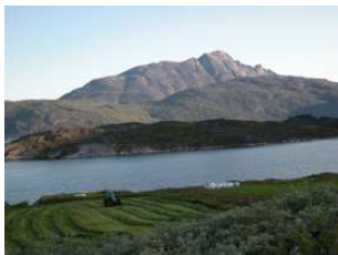
la moisson à Ipiutaq

Située le long du fjord principal reliant Narsarsuaq - l'aéroport international du Sud du pays - aux villes de Narsaq puis Qaqortoq, Ipiutaq guest farm offre une grande diversité de paysages , des hauts pics enneigés, torrents et chutes d'eau aux longues plages rocheuses et verts pâturages.