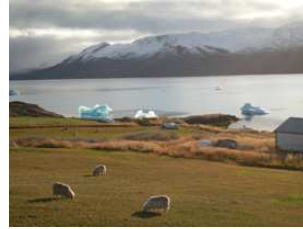
glaces et moutons