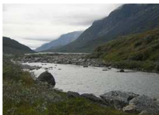
vallée et rivière Ilua