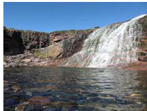
au pied d'une chute d'eau