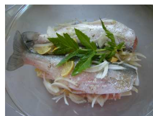
... prêtes à cuire

“A Ipiutaq, le mélange particulier d'une excellente gastronomie, du confort et de la nature sauvage groenlandaise, est absolument unique, hautement « addictif » et réellement inoubliable...”