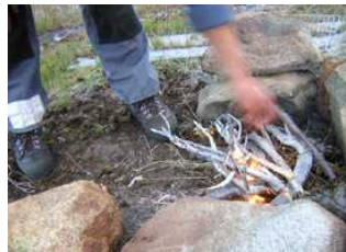
chaleur en plein air