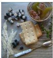
peau de baleine

An original gourmet cuisine from traditional products to a french "savoir-faire"