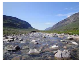
la rivière ilua l'après-midi

Si vous aimez pêcher, vous pouvez capturer des ombles de l'Arctique dans la rivière Ilua (située à une heure de marche), l'un des meilleurs lieux de pêche au Groenland . Dans le fjord juste en contrebas de notre maison, vous pouvez aussi pêcher des morues ogac ou de l'Atlantique. Agathe se fera un plaisir de les cuisiner simplement en papillote aux algues et herbes sauvages ou bien elle élaborera pour vous sa « bouillabaisse groenlandaise ».