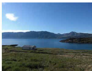
vue sur le fjord