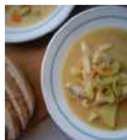
soupe de poissons